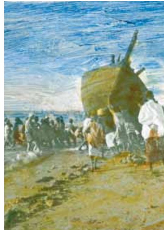
A gauche : Petit Zaroug Ci-dessus : Obock mise à l'eau Matelot à bord

Le Leica acquis dans les années 1930 donnera quant à lui des clichés d'une tout autre texture : images en noir et blanc à caractère essentiellement journalistiques, l'émerveillement de la nouveauté y est désormais absent. L'œil de Monfreid s'est manifestement exercé, et l'on sent à l'arrière-plan une distance rendue possible par une solide connaissance géopolitique de cette terre convoitée par l'Italie mussolinienne à partir de 1935. La retenue du photographe, le caractère instantané de ces prises de vue, les sujets représentés – soldats, bombardement, enfants poussant un véhicule, militaires en campagnes, femme esseulée au beau milieu des décombres – évoquent à bien des égards un univers apocalyptique aux antipodes du foisonnement des premières années. A voir ces décors poussiéreux et désolés, ce sont les bruits de bottes que l'on entend, les massacres que l'on imagine, et l'odeur de la mort, partout. Autant de témoignages de l'atrocité que fut en ces sinistres années la Campagne d'Abyssinie.